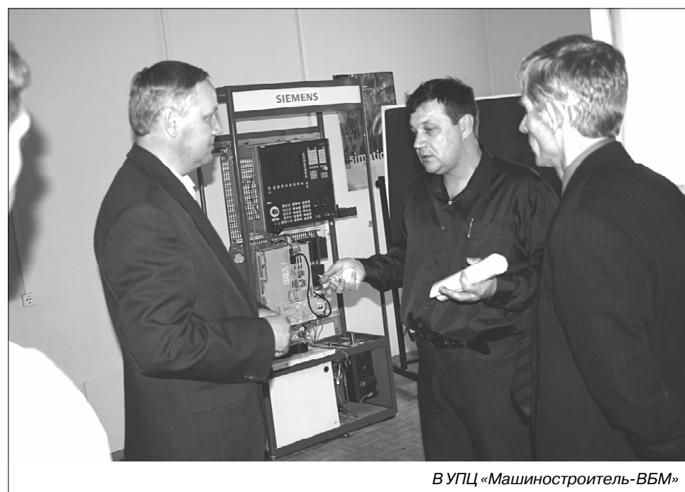
В УПЦ «Машиностроитель-ВБМ»