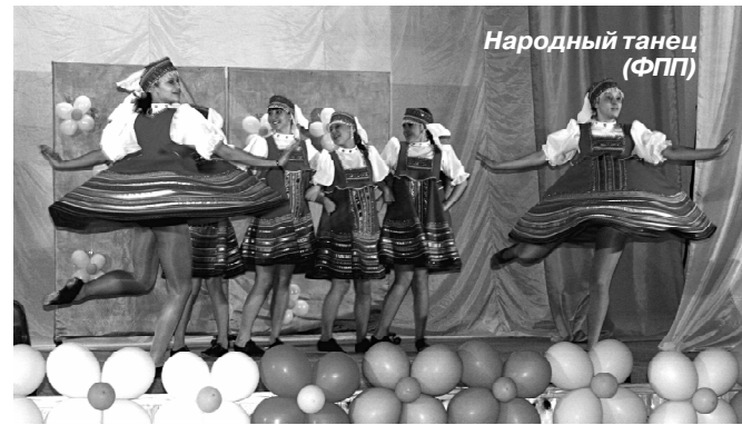
Народный танец (ФПП)

На сцене блистали непревзойденный и всем известный персонаж – Остап Бендер и его очаровательная партнерша, которую он выбрал себе в помощницы еще в начале выступления. Сюжет представления состо-