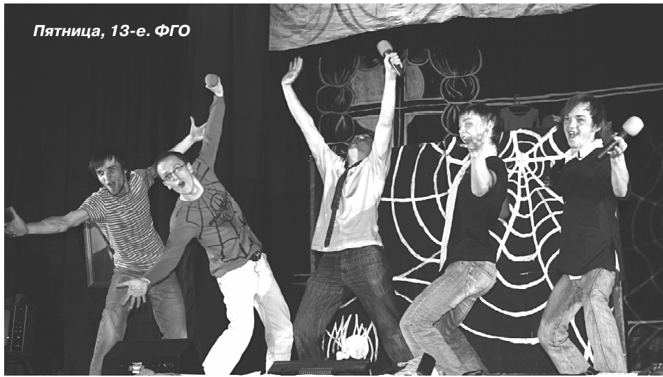
Пятница, 13-е. ФГО